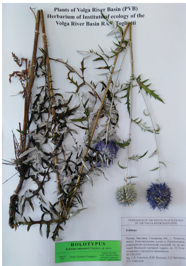
Рис. 2. Голотип Echinops saksonovii (LE). Fig. 2. Holotype of Echinops saksonovii (LE).

несколько более крупными общими соцветиями (2.5–4 в диам., а не 2–3.5 в диам.), фиолетовыми (а не синими) венчиками. От E. sphaerocephalus L. отличается более низкими стеблями 50–150 см